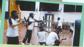
攻防箭遊戲活動體驗