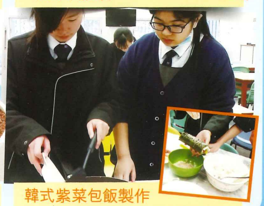
韓式紫菜包飯製作