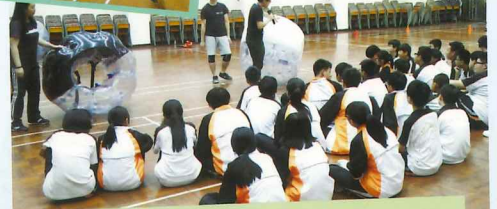
泡泡足球遊戲活動體驗