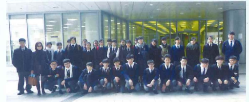
中六級視藝科同學畢業展 24-26.2.2016 參觀教育局中學生視覺藝術創作展 12.1.2016